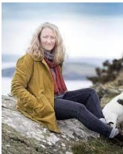
Raynor Winn l'autrice