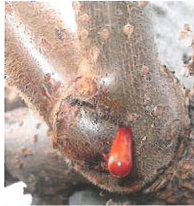
Suintement frais rouge orangé