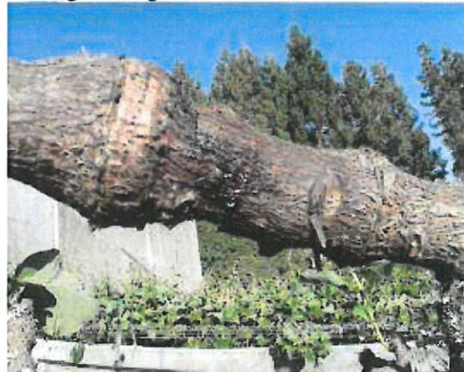
Chancre sur le plant de kiwis