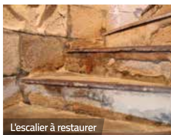
L'escalier à restaurer

Ce prochain chantier s'inscrit dans le cadre de la restauration des Monuments Historiques. Tout comme celui actuellement en cours rue du Marhallé. Depuis lundi 3 septembre, les travaux de restauration du mur de soutènement du haut-mail ont débuté. En conséquence, la rue est fermée à la circulation durant la durée des travaux (3 mois environ). Une circulation piétonne est tout de même maintenue pour l'accès aux propriétés.