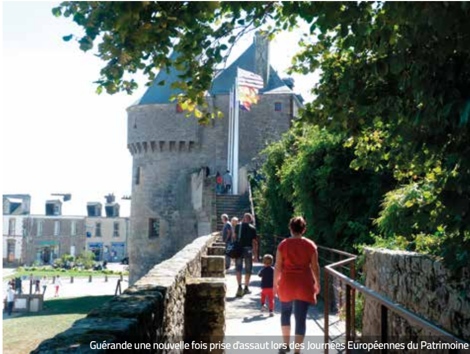
Guérande une nouvelle fois prise d'assaut lors des Journées Européennes du Patrimoine