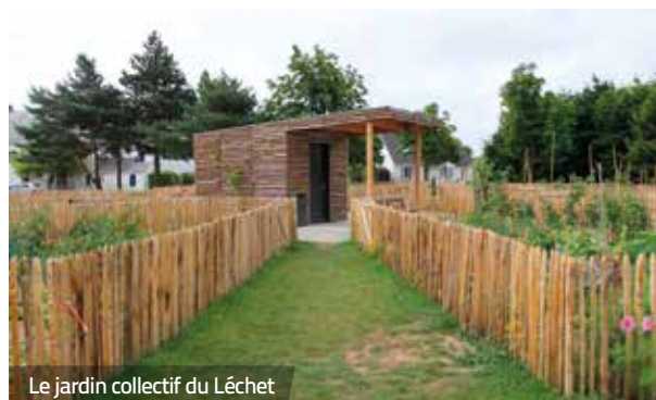
Le jardin collectif du Léchet

Le Pré fertile constituera le plus vaste espace vert de l'écoquartier Maison Neuve. Au sein de cette surface de près de 2 hectares, la municipalité a décidé d'aménager plusieurs milliers de mètres carrés de jardins. Associatifs, partagés ou familiaux ? Un appel à la population est lancé afin qu'un projet collaboratif soit construit.