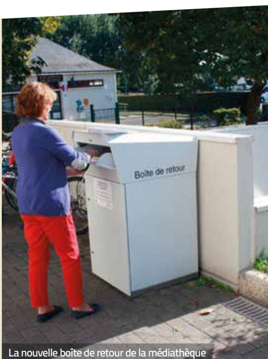
La nouvelle boîte de retour de la médiathèque

Quelques règles sont tout de même à respecter. Si la médiathèque Samuel Beckett est ouverte il ne sert à rien de l'utiliser puisque les agents municipaux seront toujours plus accueillants et souriants que la boîte métallique. Évidemment, si elle est pleine, pas la peine d'insister et de risquer d'abîmer les documents ! À noter également : les retours de jeux de la ludothèque ne sont pas autorisés. Enfin, il est important de vérifier après tout dépôt que les documents sont bien inaccessibles.