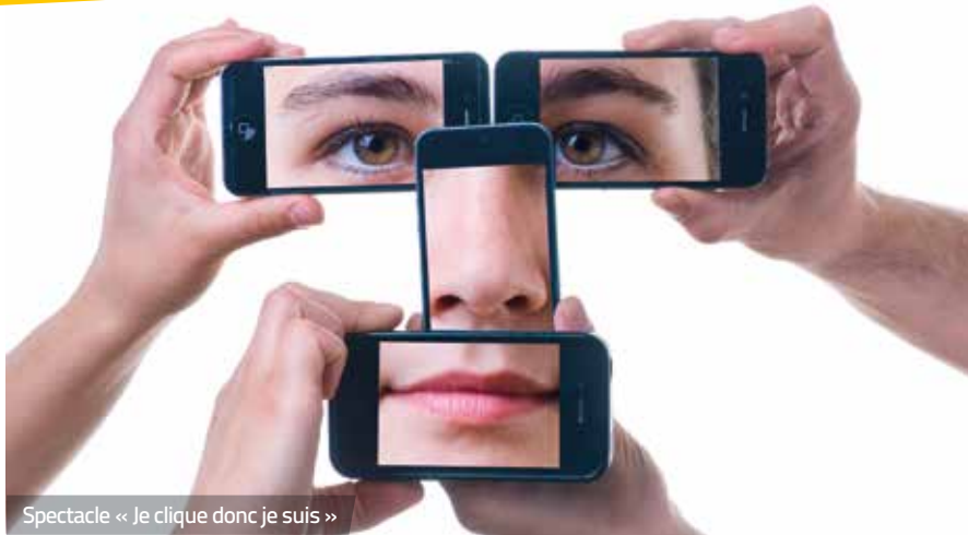
Spectacle « Je clique donc je suis »