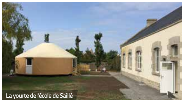
La yourte de l'école de Saillé

La bonne nouvelle tombe au mois de juin. L'Éducation nationale annonce aux élus de Guérande qu'une 3 e classe peut être ouverte pour répondre à l'augmentation de l'effectif de l'école Jeanne de Navarre de Saillé à la rentrée scolaire 2018. C'est noté. Le compte à rebours est lancé. Il reste 3 mois pour accueillir les élèves dans des conditions optimales d'apprentissage.