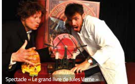
Spectacle « Le grand livre de Jules Verne »

Et dans l'agenda (pages 18 et 19) retrouvez toutes les activités proposées dans le cadre de "Voyage au centre de... la science" en un coup d'œil grâce à ce picto.