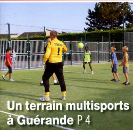
Un terrain multisports à Guérande P 4