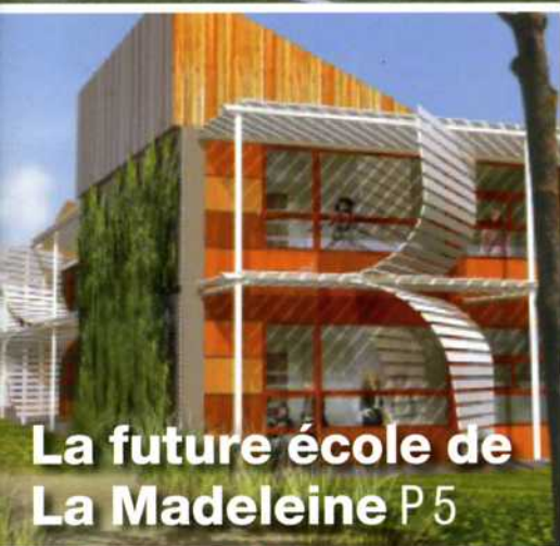
La future école de La Madeleine P 5