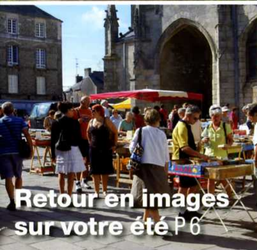
Retour en images sur votre été P 6