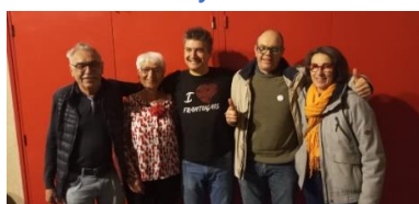
Instants de soulagement après le spectacle