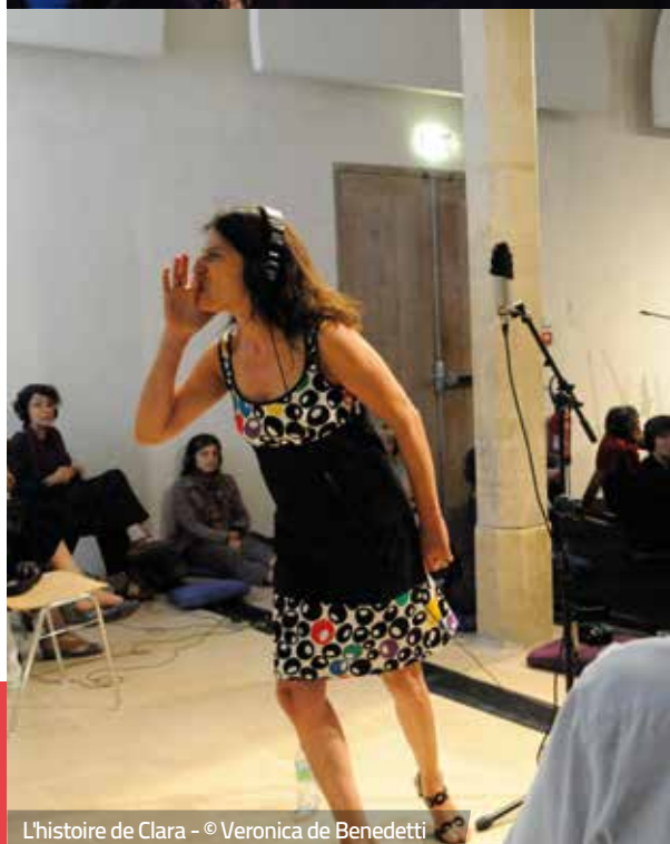
L'histoire de Clara