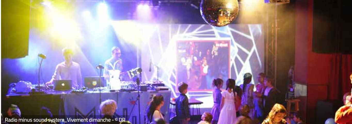
Radio minus sound system_Vivement dimanche