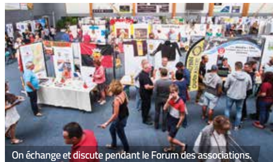
On échange et discute pendant le Forum des associations.

Pour la 6 e année consécutive, 72 associations se sont donné rendez-vous à la salle des sports de Kerbiniou pour présenter leurs actions. Cet évènement est devenu incontournable pour les bénévoles. Il permet de valoriser le dynamisme du tissu associatif guérandais.