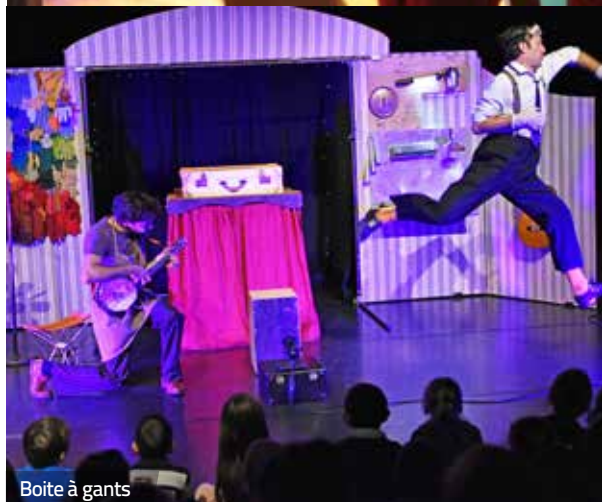
Boîte à gants