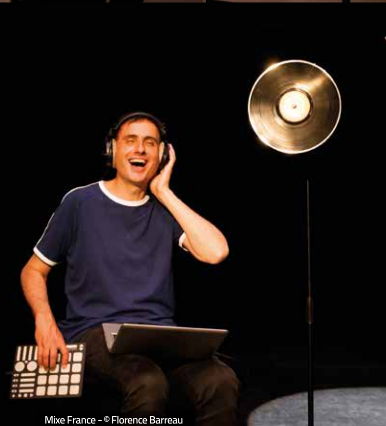
Mixe France