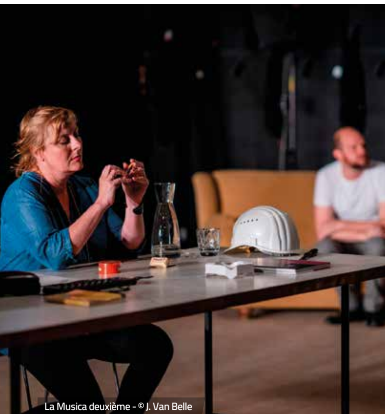
La Musica deuxième - © J. Van Belle