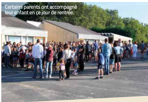
Certains parents ont accompagné leur enfant en ce jour de rentrée.