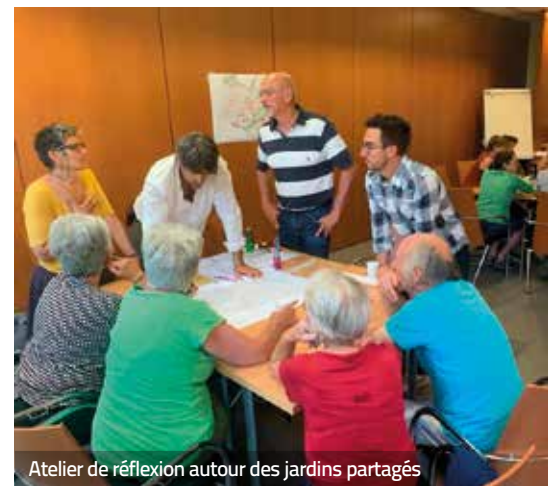
Atelier de réflexion autour des jardins partagés

Un 4 e atelier est organisé jeudi 3 octobre à 18h à l'Hôtel de Ville.