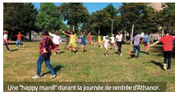
Une "happy manif" durant la journée de rentrée d'Athamor.