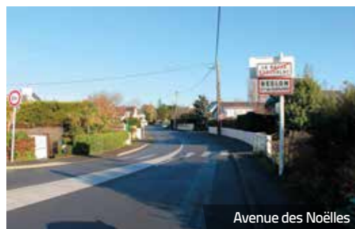
Avenue des Noëlles