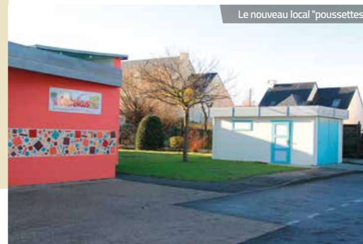
Le nouveau local "poussettes"