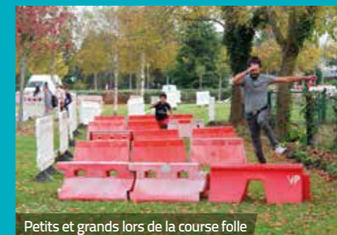
Petits et grands lors de la course folle