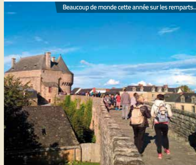
Beaucoup de monde cette année sur les remparts...

Les remparts rouvriront le 1 er avril 2018 avec une nouvelle exposition temporaire du musée du pays de Guérande sur le camp d'internement installé au petit séminaire entre 1914 et 1919 (cf. dossier pages 8 et 9).