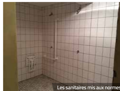
Les sanitaires mis aux normes