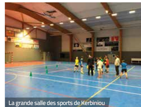
La grande salle des sports de Kerbinou

Dans le cadre de son agenda d'accessibilité programmé (ADAP), la Ville poursuit les aménagements visant à améliorer les conditions d'accueil des personnes à mobilité réduite dans ses bâtiments publics.