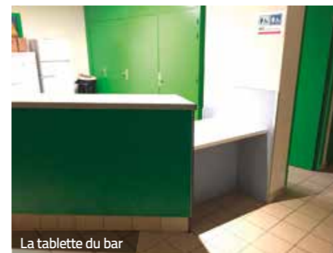
La tablette du bar