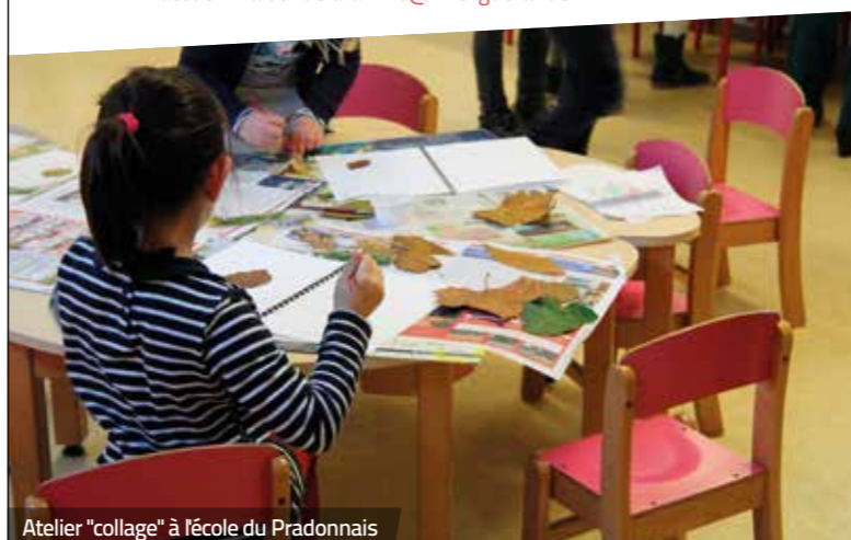
Atelier "collage" à l'école du Pradonnais

02 40 15 10 50 accueil.maisondela famille@ville-guerande.fr